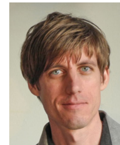
Max Tertinegg Coinfinity GmbH